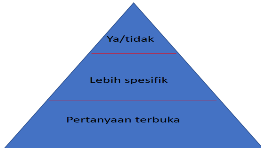
Gambar 4.2 Ilustrasi dalam bobot pertanyaan dengan Auditee di Prodi